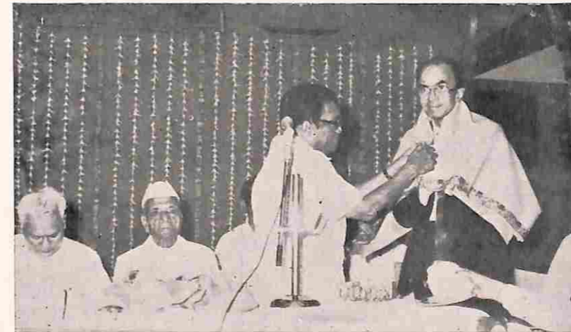
'પદ્મશ્રી' એવોર્ડ પ્રાપ્ત કરનાર પૂર્વ વિદ્યાર્થી પિડિયાટ્રીક સર્જન તરીકે આંતરરાષ્ટ્રીય ખ્યાતિ મેળવનાર ડૉ. આર. કે. ગાંધી