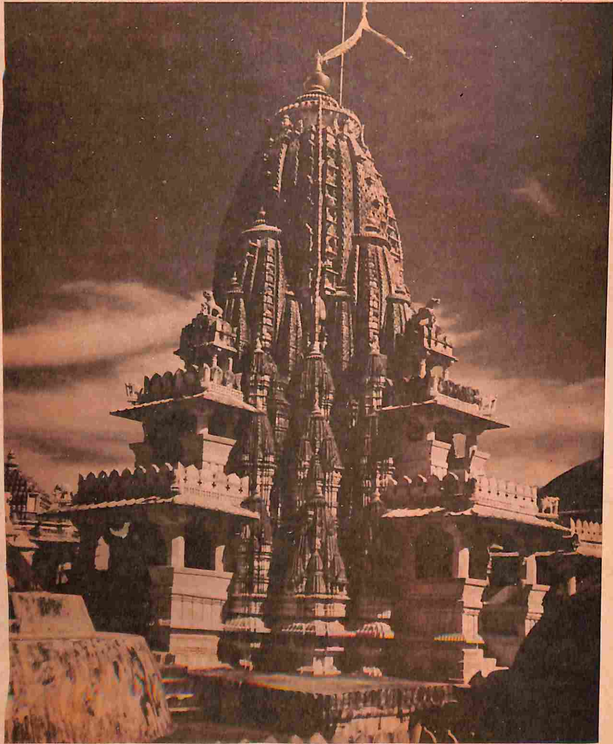
પંદરમી સદીનું શિલ્પકળાની સંગેભરમર કારીગરીનું અત્યુત્તમ પ્રાચીન જિનપ્રાસાદ, રાણુકપુર