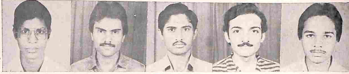
ભરત પુ. શાહ બી. કોમ. અહત ડા. શાહ એસ વાય બી. કોમ. દિતેન્દ્ર બા. વાસા કૃષિત હ. દેસાઈ એફ વાય બી. કોમ. કેતન જી. કુવ