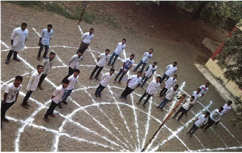
વિદ્યાલયની શાખાઓમાં ધ્વજવંદન