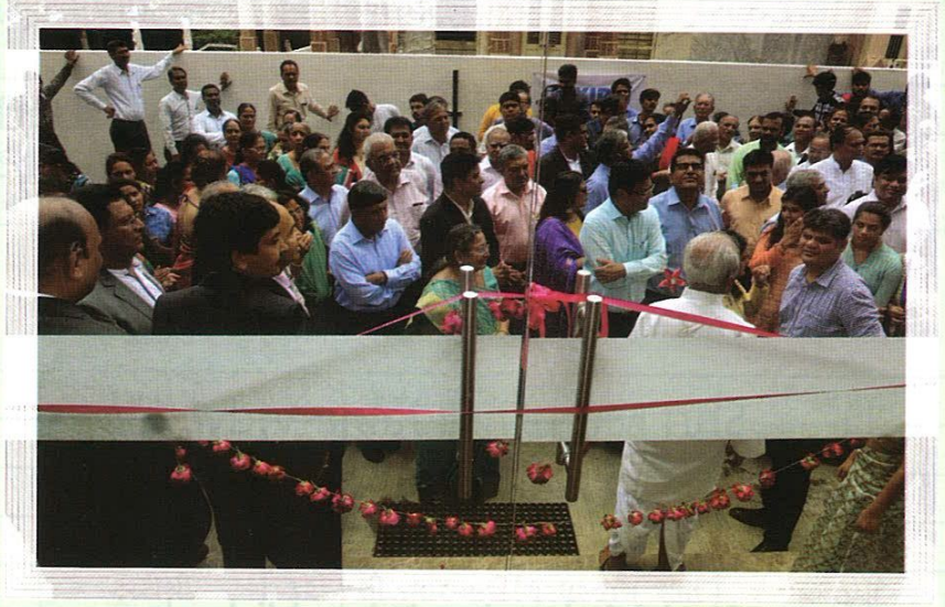
વડોદરા કન્યા છાત્રાલયના શુભ ઉદ્ઘાટન પ્રસંગે પધારેલા મહેમાનો