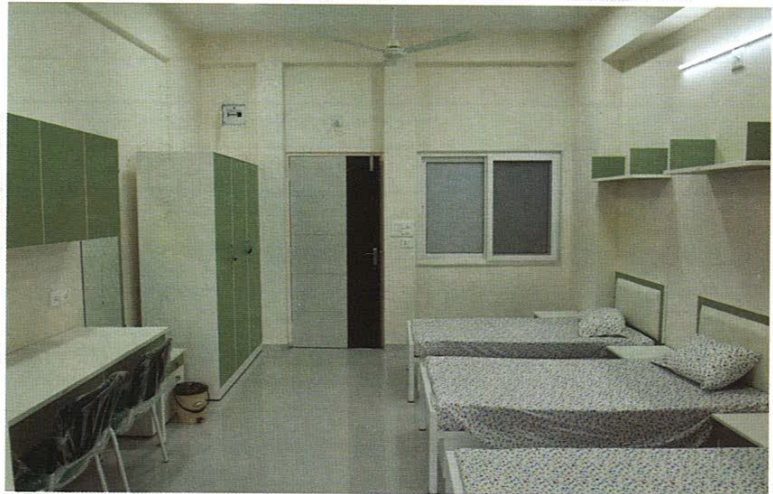
આધુનિક સગવડતા સાથે વિદ્યાર્થિનીની રૂમ – વડોદરા કન્યા છાત્રાલય