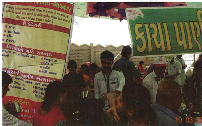
શ્રી મહાવીર જૈન વિદ્યાલય- ૧૦૨મો વાર્ષિક અહેવાલ