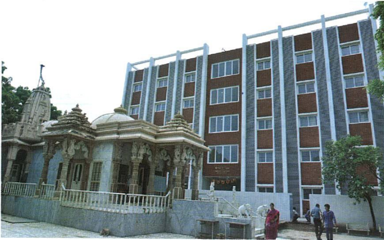
વડોદરા કન્યા છાત્રાલયનું નૂતન મકાન